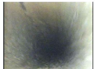
写真1 硬質ポリ塩化ビニル管（管径100mm 清掃前）