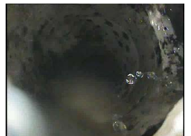
写真2 硬質ポリ塩化ビニル管（管径100mm 清掃後）